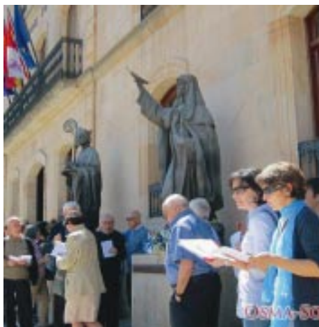
Homenaje a la Madre Sor María de Jesús de Ágreda (pág. 4)

HOJA DIOCESANA DE OSMA-SORIA • DELEGACIÓN DE M.C.S. • AÑO XX - NÚM 432 • 16-30 JUNIO 2011