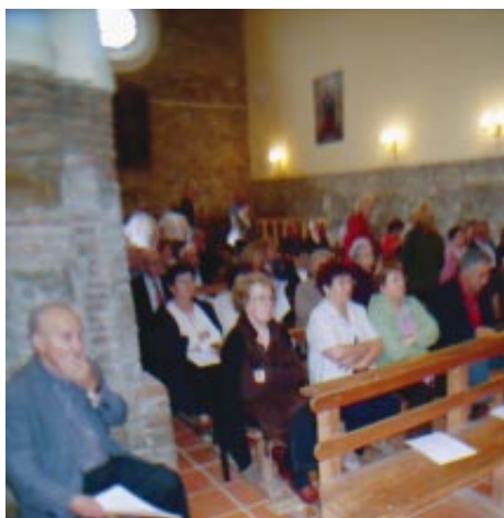
Día del Arciprestazgo de Tierras Altas (pág. 4)