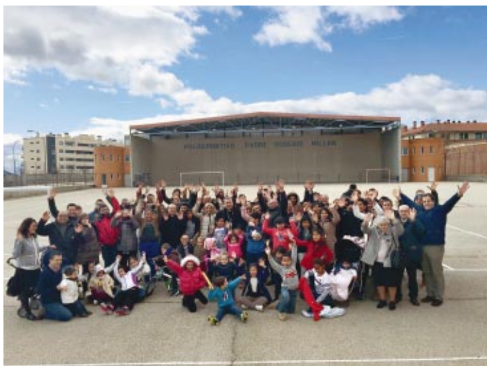
Treinta matrimonios compartieron un día de convivencia, oración, reflexión y celebración con motivo del VI encuentro de matrimonios con el Obispo.