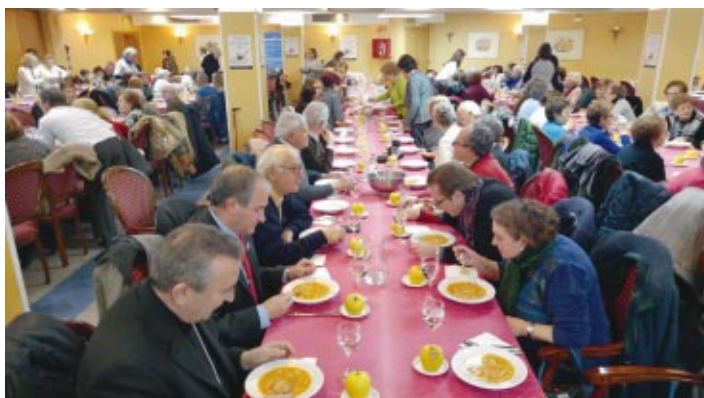
Más de doscientas personas participaron en la Cena solidaria de Manos Unidas que se celebró en los Salones Rosaleda de la capital soriana.