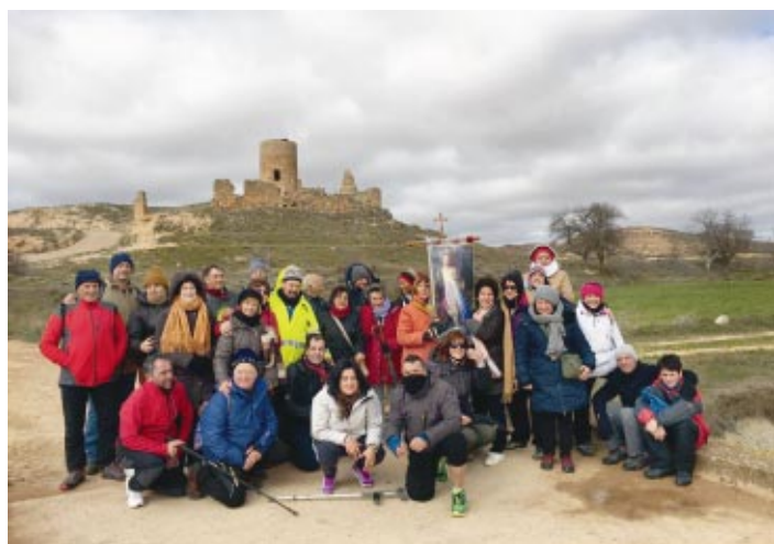
Continúa la peregrinación del estandarte de la misericordia. Próxima etapa: Monteagudo de las Vicarías-Santa María de Huerta.