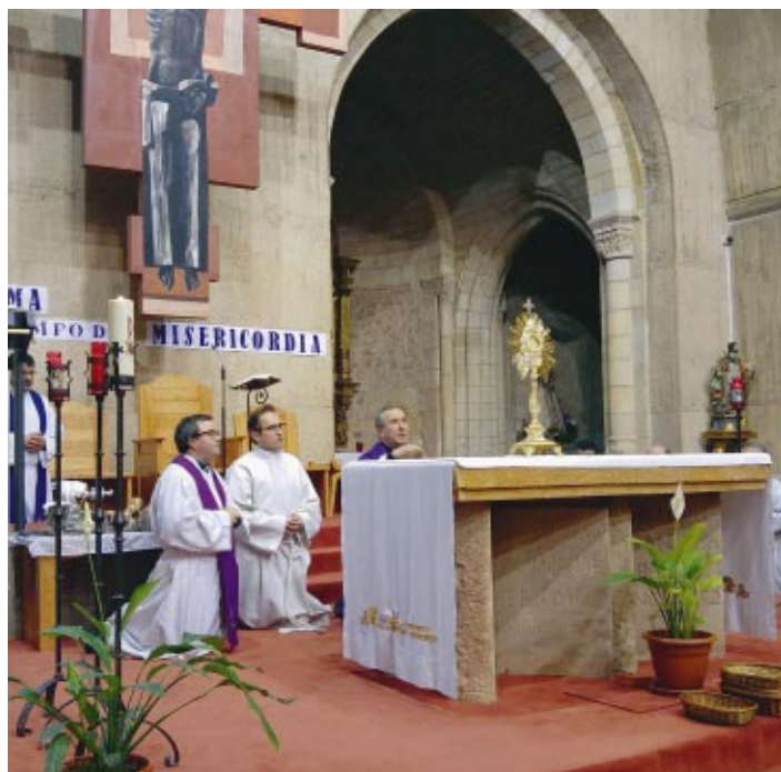
Centenares de fieles participaron en la iniciativa "24 horas para el Señor" en la parroquia de El Salvador. El Obispo presidió la Santa Misa y el Sacramento de la reconciliación.