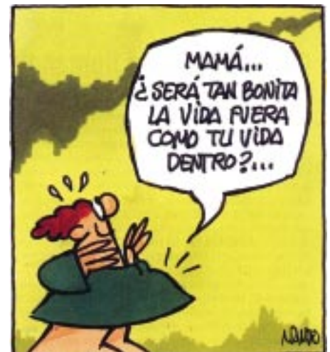
De Vida Nueva