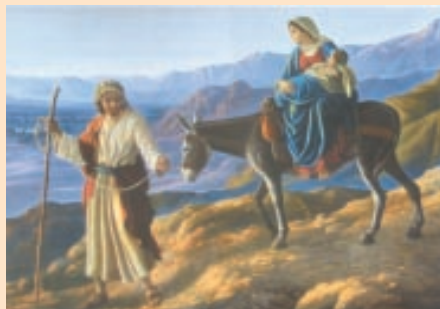
La Sagrada Familia regresa a su patria desde que huyeron a Egipto para salvar la vida de Jesús, amenazada de muerte del rey Herodes.

Entremos en el Nuevo Año con Jesús, María y José. Que Dios ilumine nuestras vidas y nos ayude a que sean caminos de encuentro fraterno para conseguir la deseada felicidad.