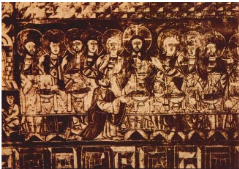
San Andrés. Pintura antes de ser arrancada. La Última Cena

HOJA DIOCESANA DE OSMÁ-SORIA • DELEGACIÓN DE M.C.S. • AÑO XX - NÚM 428 • 16-30 ABRIL 2011