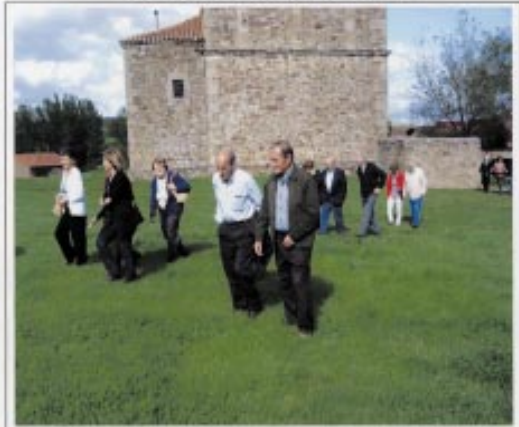
ERMITA VIRGEN DE LA PEÑA

5,00 tarde: Concentración Oración compartida Reflexión: "LOS MAYORES UN GRAN VALOR EN LOS PUEBLOS" Merienda y fiesta compartida