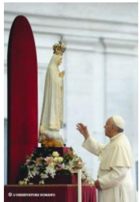
(Papa Francisco en el acto de consagración del mundo al Inmaculado Corazón de María, 13 de octubre de 2013)