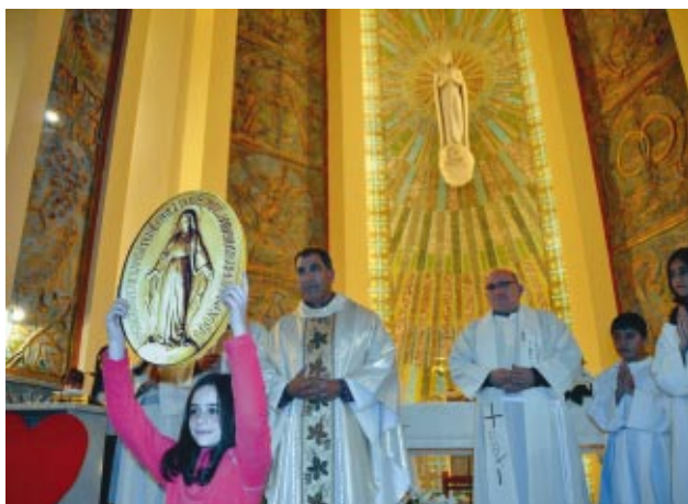
El Colegio del Sagrado Corazón (Soria) celebró el Triduo en honor de la Virgen milagrosa.