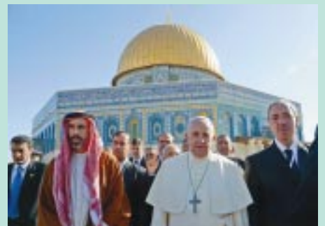
En la explanada de las mezquitas.