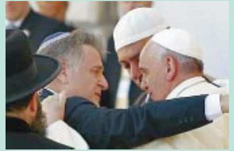
Francisco, el rabino Skorka y el musulmán Omar Abboud se abrazan ante el muro de las lamentaciones.