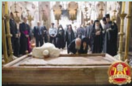
El Santo Padre y el Patriarca visitan y veneran el Santo Sepulcro.