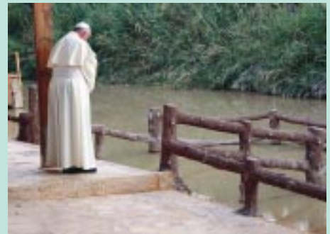
Visita y oración a orillas del río Jordán.