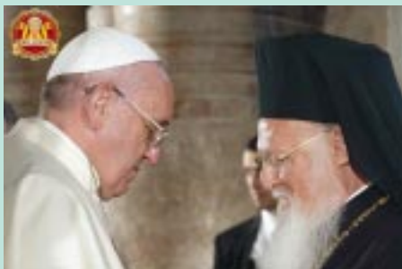
El Papa Francisco saluda al Patriarca Bartolomé.