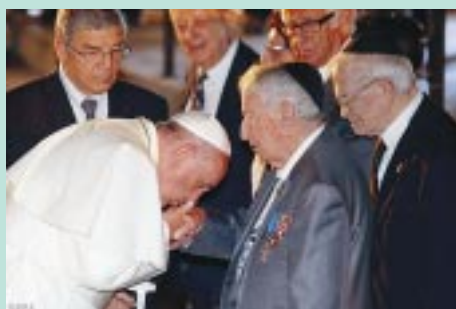
En el memorial del holocausto judío, Francisco besa a algunos supervivientes del genocidio nazi.