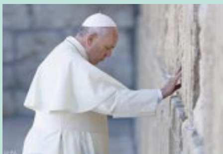
Oración ante el muro de las lamentaciones en la ciudad de Jerusalén.