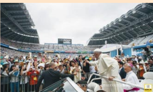
Santa Misa en el estadio de Seúl.