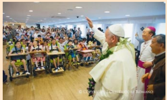
Visita a un cotolengo en Kkottongnae.