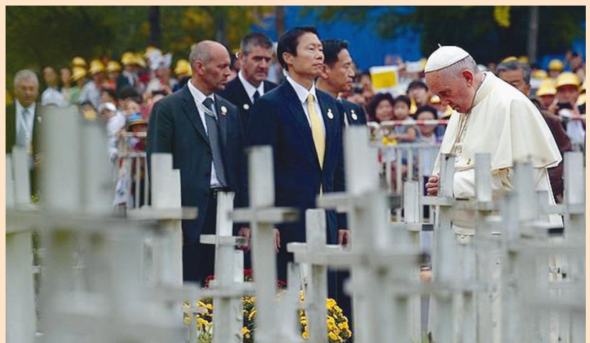
Oración en el cementerio de los niños no nacidos víctimas del aborto.