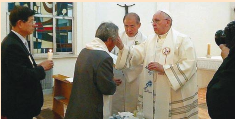
Francisco bautiza en la Nunciatura al padre de uno de los muertos en el naufragio del ferry Sewol.