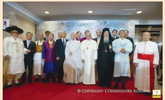
El Papa se encuentra con los líderes de las distintas confesiones religiosas.