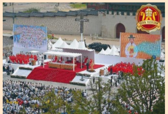
Santa Misa de beatificación de 124 mártires coreanos.