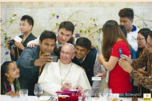
Comida con jóvenes participantes en la Jornada Asiática de la Juventud.