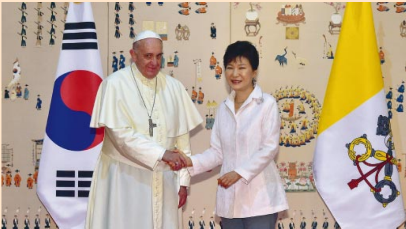
Encuentro con la presidenta de Corea del Sur, Park Geun-Hye.