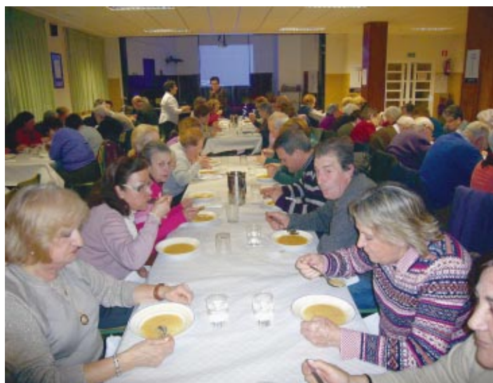
La parroquia de Almazán celebra la tradicional cena del hambre a favor de Manos Unidas.