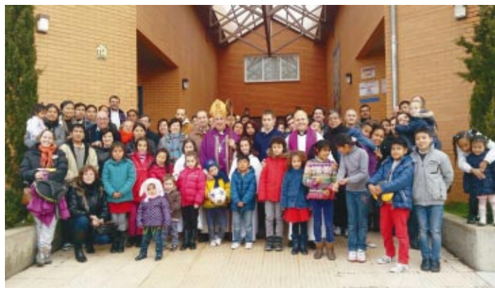
Éxito del V encuentro de matrimonios celebrado en el Colegio de los PP. Escolapios (Soria).