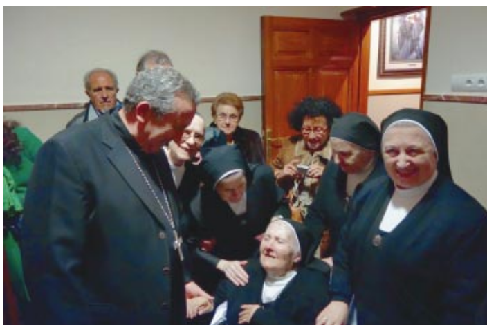
La Sierva de Jesús, Sor Josefina Rojo, celebrando sus 100 años de vida. En la imagen junto al Obispo de Osma-Soria y la Superiora General de las Siervas, entre otros.