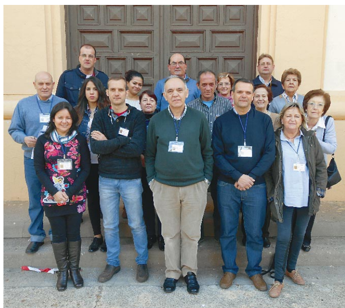
Clausura del Cursillo de cristiandad en Soria.