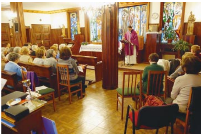
Más de medio centenar de adoradoras en la Asamblea anual de ANFE diocesana.