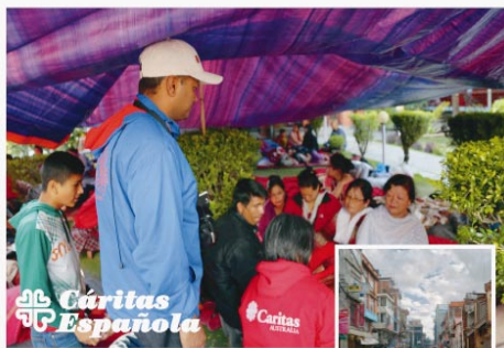
La Iglesia, Caritas Nepal y la Red Internacional de Caritas, presentes en el terreno desde antes de tener lugar el terremoto, se han movilizadо inmediatamente para prestar auxilio a los afectados, colaborando en las tareas de rescate, en la distribución de agua, alimentos, refugio y otros artículos de primera necesidad.