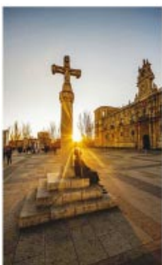
La tarea de la evangelización de todos los hombres constituye la misión esencial de la Iglesia. Pedro II, Evangelio sinodal, n. 34