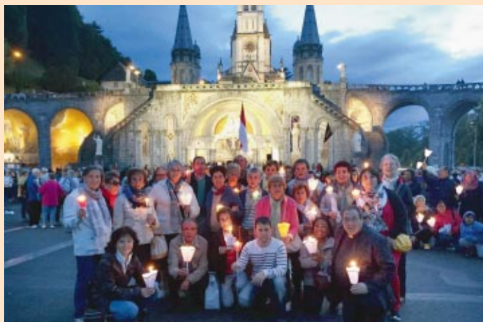
Treinta diocesanos participaron en la peregrinación al santuario de Lourdes.