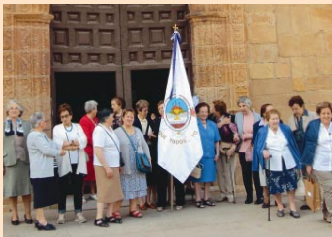
La UNER peregrinó a la S. I. Concatedral para ganar el Jubileo.