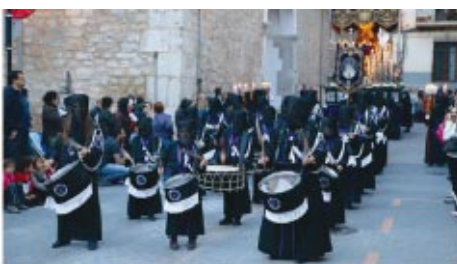
Actualmente hay 3.489 cofradías inscritas en el Registro de Entidades Religiosas, sin contar muchas más que existen y cuya actividad se circunscribe a un ámbito más reducido o parroquial

La actividad pastoral emplea 47,6 millones de horas de sacerdotes, religiosos y seglares, lo que supone un ahorro para la Iglesia de 1.115 millones de euros. Gracias a este inmenso caudal de generosidad de quienes dedican su tiempo al servicio de la misión de la Iglesia y teniendo en cuenta el total del dinero que ella emplea, podemos afirmar que 1 euro en la Iglesia rinde como 2,26 € en servicio a la sociedad.