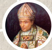
Fray Tomás de Berlanga Comprometido en la defensa de los indígenas.