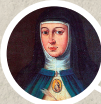
Venerable Sor María Jesús de Ágreda Sin salir del Claustro, evangelizó en Nuevo México.