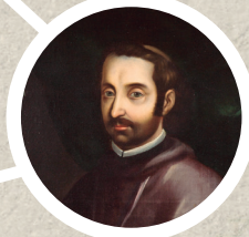
El Beato Palafox Como obispo de Puebla su labor fue ingente.