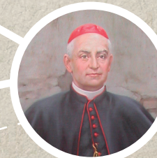
Beato Ciriaco María Sancha y Hervás Partió a Santiago de Cuba, donde se entregó a los pobres.