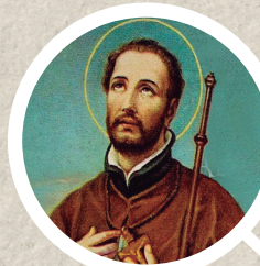
San Francisco Javier Declarado patrono de las misiones de la Iglesia católica.