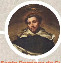
Santo Domingo de Guzmán Fundó la Orden de predicadores, llevando a todas partes la luz del evangelio.