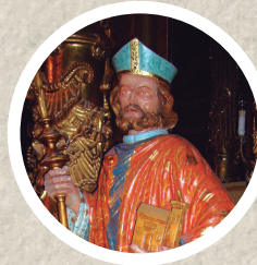
San Pedro de Osma Renovó material y espiritualmente la Diócesis de Osma.