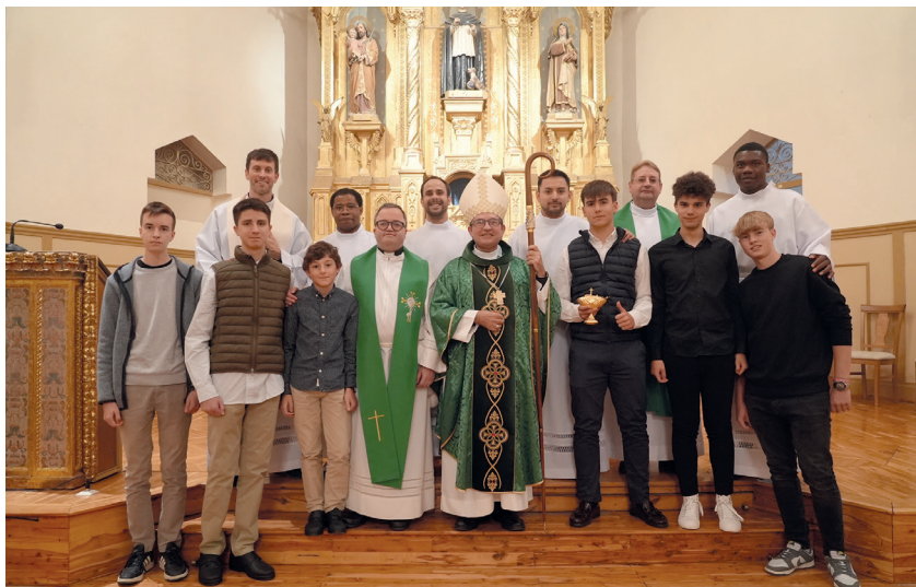
Inauguración del curso en el Seminario Diocesano