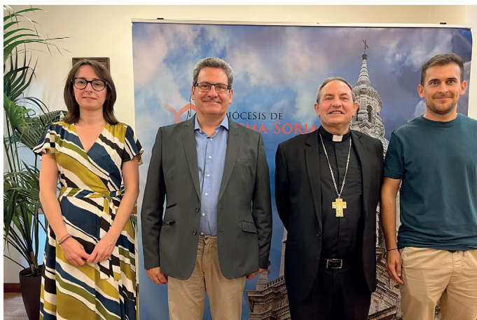
Nuevo equipo de Cáritas