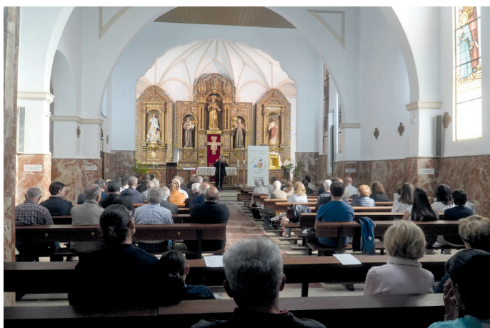
Presentación de la programación pastoral

La Diócesis presentó el día 18, en la iglesia de los Padres Franciscanos de la ciudad de Soria, la programación pastoral para el curso 2024-2025. Un nutrido grupo de fieles y representantes de los diferentes estamentos diocesanos asistieron al acto presidido por el obispo de Osma-Soria.