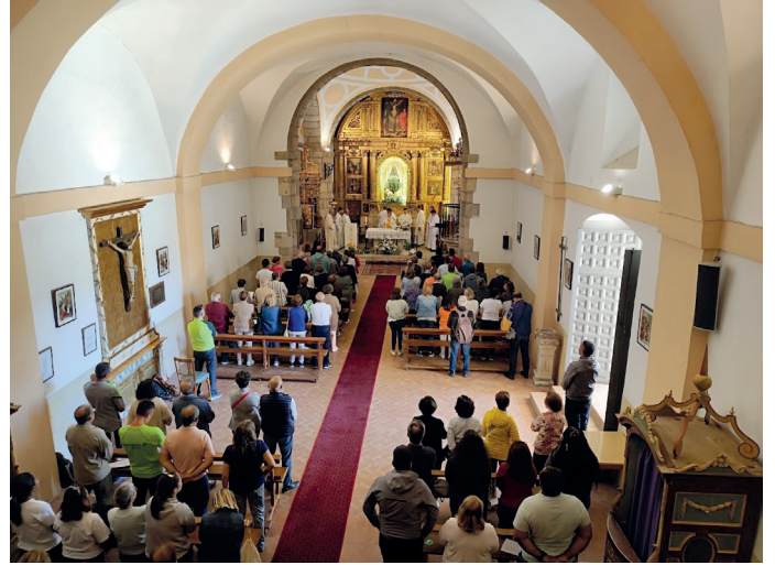
Eucaristía en el Santuario de Nuestra Señora de Inodejo