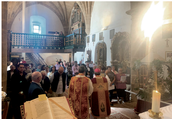
Bendición de las obras en la iglesia de Mezquetillas